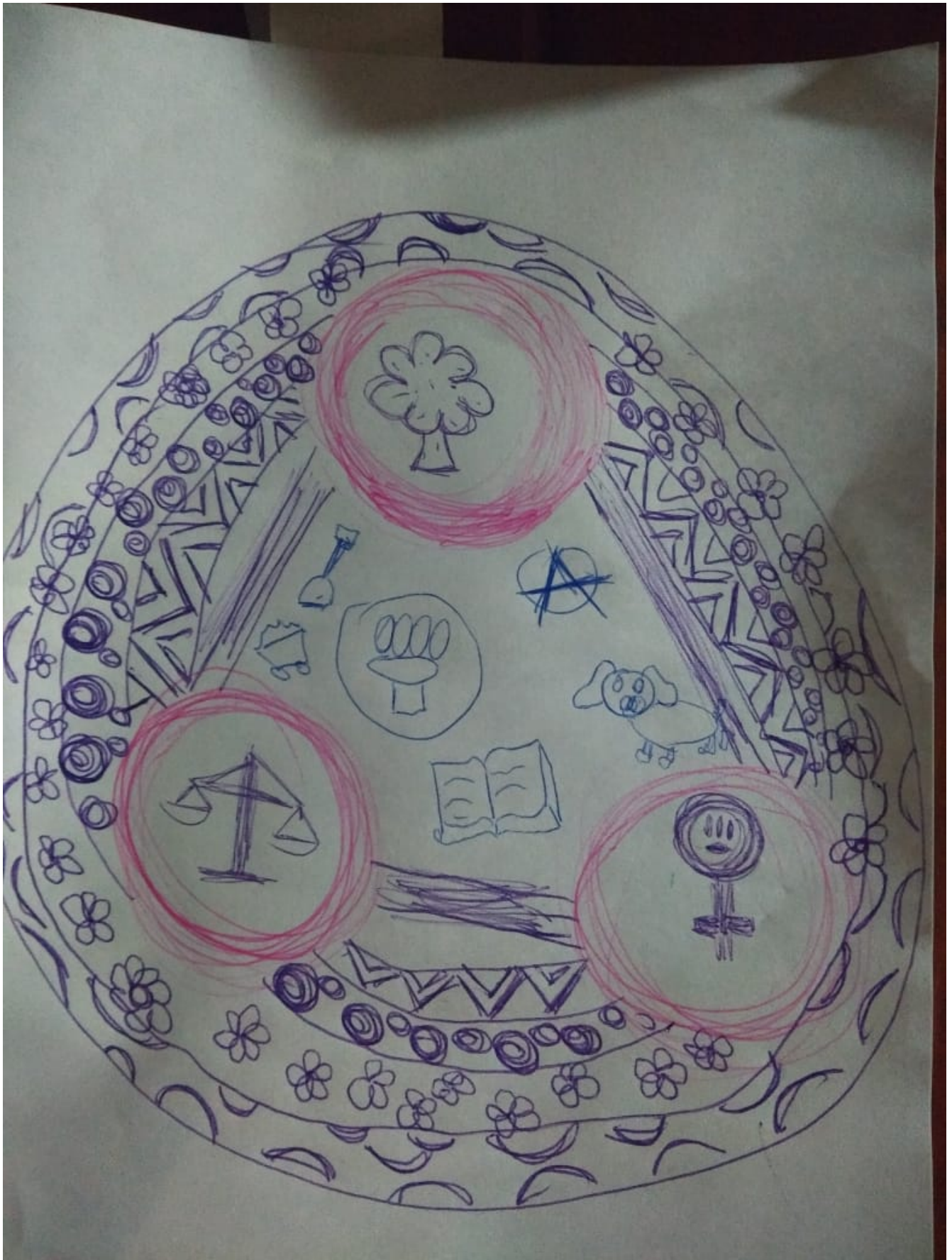
Trabajo de identificación. Quiénes somos, qué nos identifica,