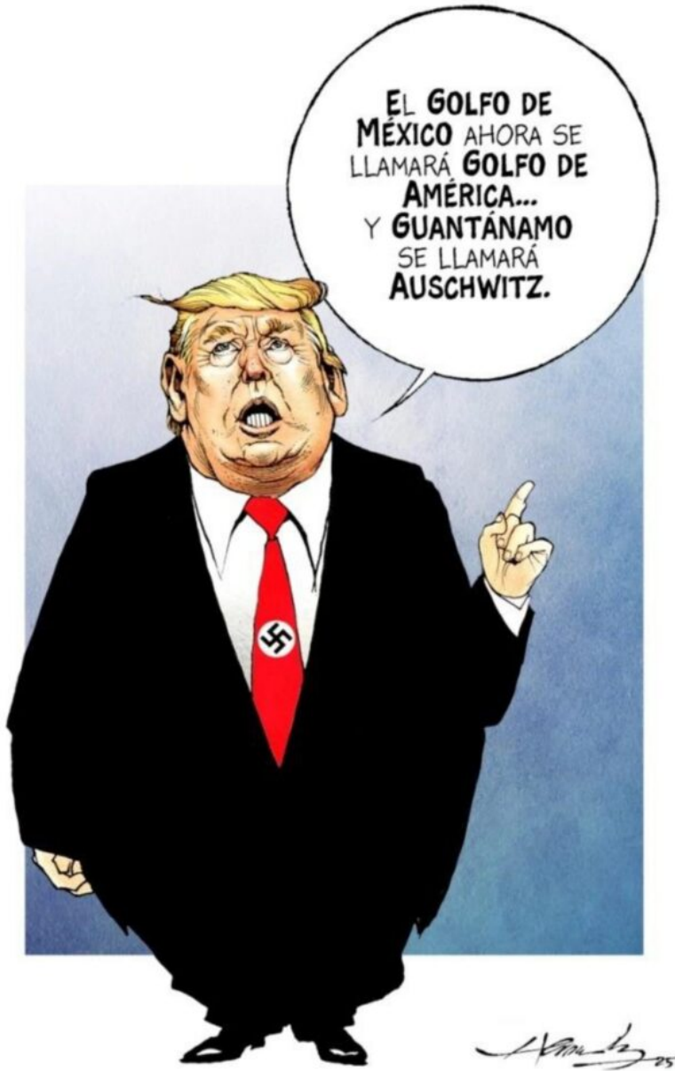
Cartón de Hernández

A es ca so s dí as de as um ir el po de r Tr um p, el go bi er no de la 4T an un ci a un a de po