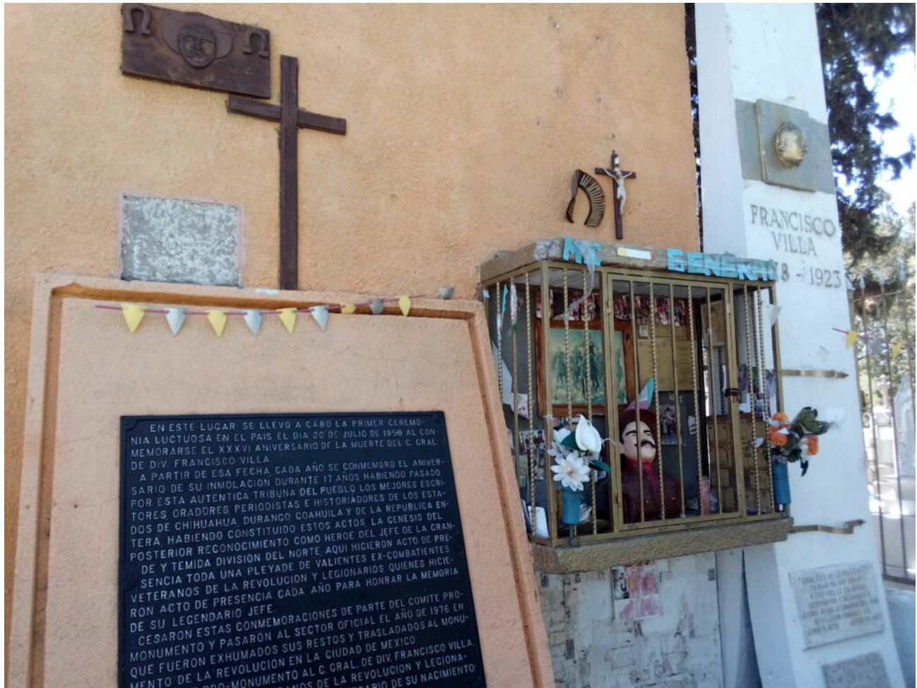
Tumba de Villa en Parral, Chih.