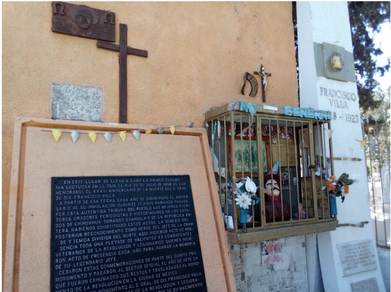
Tumba de Villa en Parral, Chih.

Grupo Editorial de la Casa de Todas y Todos.