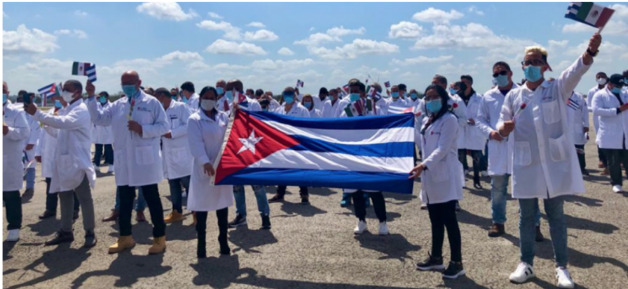
Regresó Brigada Henry Reeve que asistió en México ante COVID-19. salud.msp.gob.cu. Marzo 2021

que pretende la universalización del sistema de salud como derecho teniendo como base la atención primaria de la salud, resulta en una implementación inejecutable.