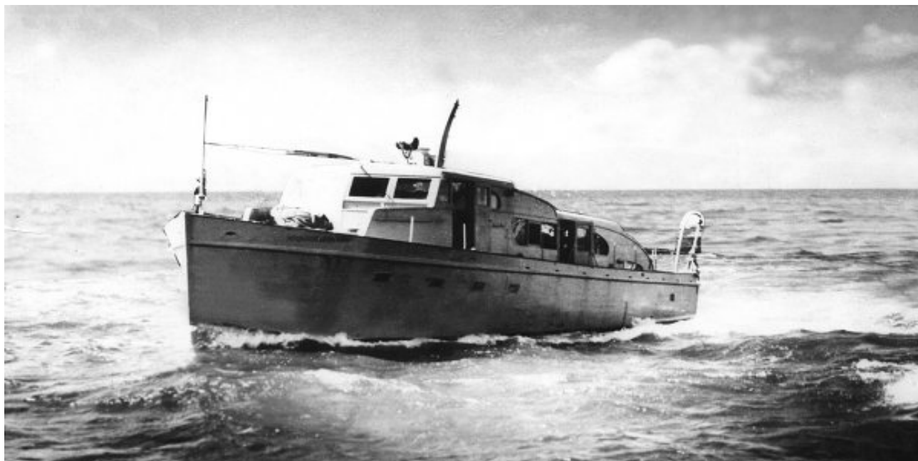
Imágen del yate Granma

Nuevos barcos han partido ya a los mares turbulentos de los mundos que se transforman en cada país, cada tierra, cada pueblo y ciudad, en cada paso que la memoria resurge en futuros que se trabajan, luchan y defienden ante los nuevos imperialismos y colonialismos que la humanidad padece.