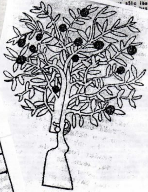
En la primavera de ese año se ocupó la casa. Comenzó en seguida a funcionar como