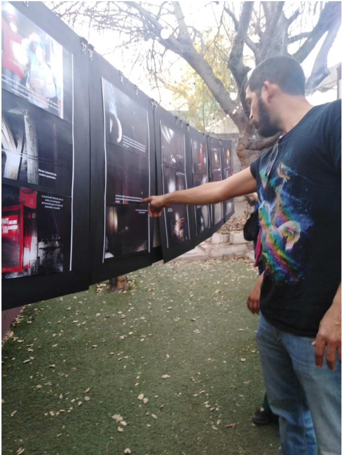
Recorrido en Casa Colectiva a cargo de un compañero de la JCM.