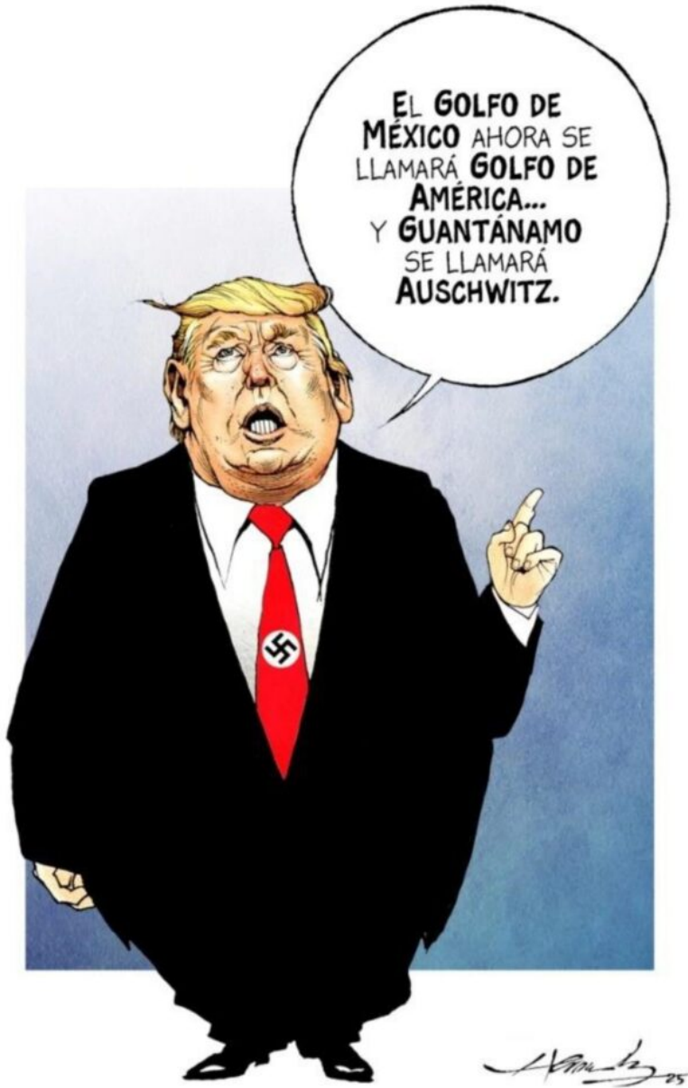
Cartón de Hernández

A es ca so s dí as de as um ir el po de r Tr um p, el go bi er no de la 4T an un ci a un a de po