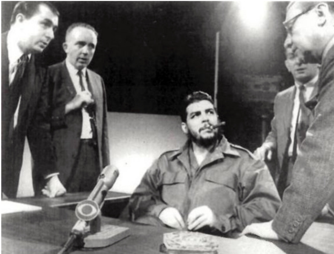
Preparativos de la entrevista.

un conflicto, un conflicto ideológico que todos conocemos. Hemos establecido nuestra posición en el sentido de la unidad entre los Estados socialistas. La unidad es la primera medida y sostenemos siempre que la unidad es necesaria porque la desunión favorece a Estados Unidos, que es nuestro enemigo y todo lo que esté a favor del enemigo debe ser eliminado. He ahí el por qué estamos a favor de la unidad. Creemos que existe la necesidad de fortalecer esta unidad y que ella será fortalecida y que el bloque monolítico de los países socialistas se formará otra vez.